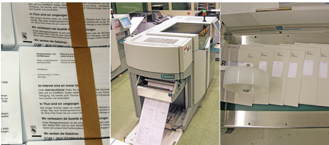
Sur demande, Bedag prend en charge l'impression et l'envoi des convocations.